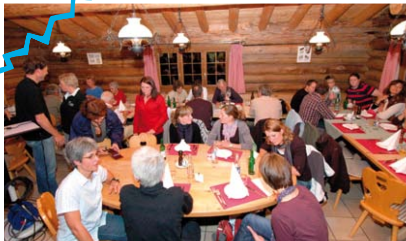
Nach der Arbeit das kulinarische Vergnügen.

Informationen und Hinweise finden sich auf der Homepage: www.skiclub-klosters.ch